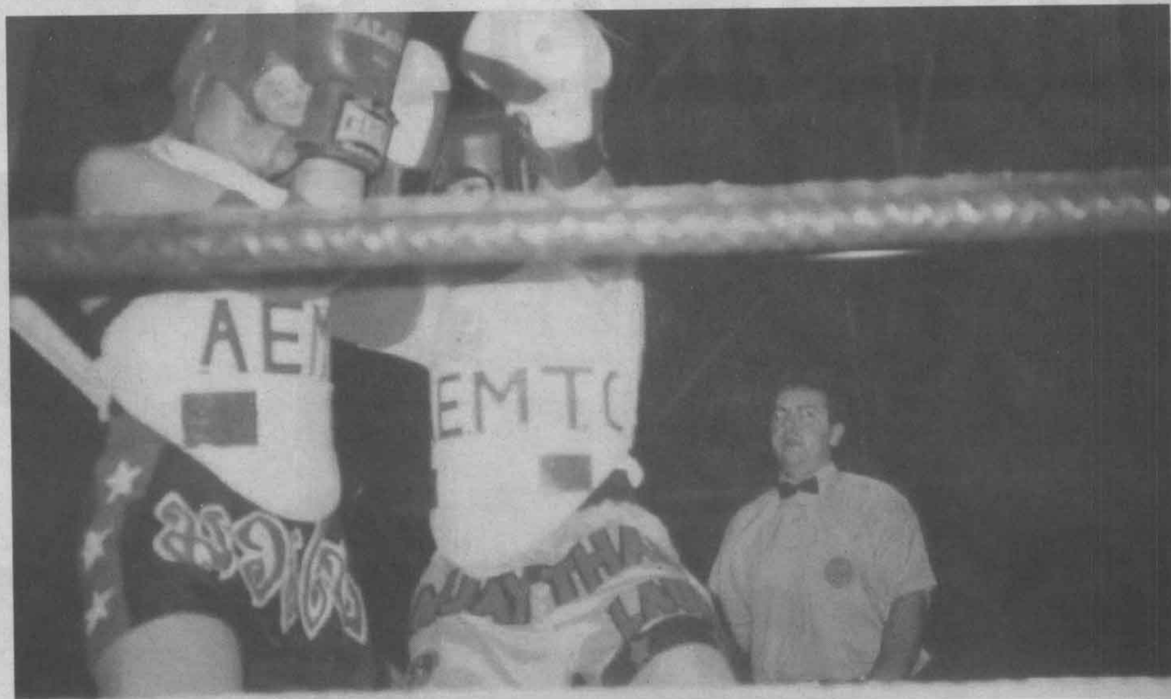
TENSIÓN PARA LA PÚGIL LOCAL POR PARTE DE LAS DEVASTADORAS TÉCNICAS DE CODO DE LAURA.

Autor: Sergio Manuel Muela Fernández, alumno directo del Maestro Lek.